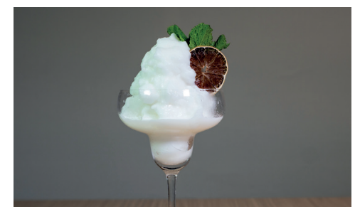
SORBETE DE LIMÓN AL CAVA