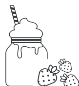
Fresa · Strawberry