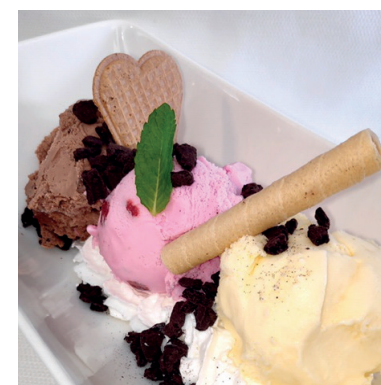
3 BOLAS DE HELADO