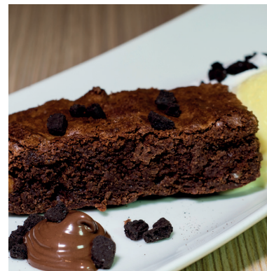
BROWNIE CON HELADO