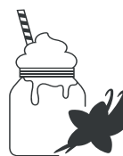
Vainilla · Vanilla