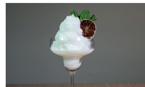
SORBETE DE LIMÓN AL CAVA