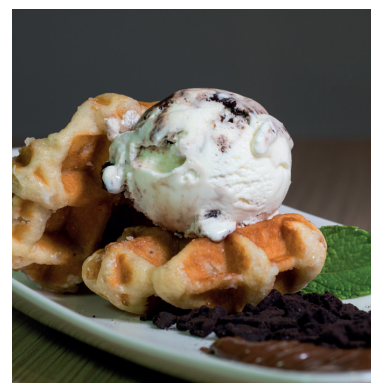
GOFRE CON HELADO